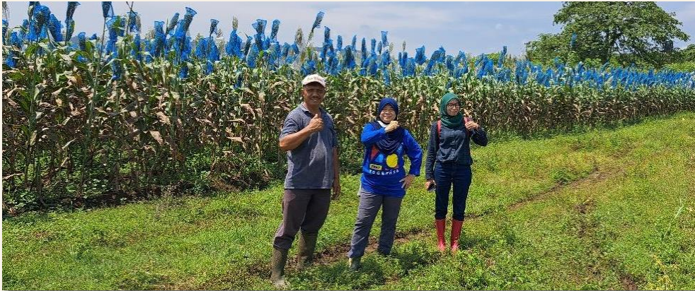
BUDIDAYA SORGUM DI KEC. JONGGOL, KAB. BOGOR (2020)