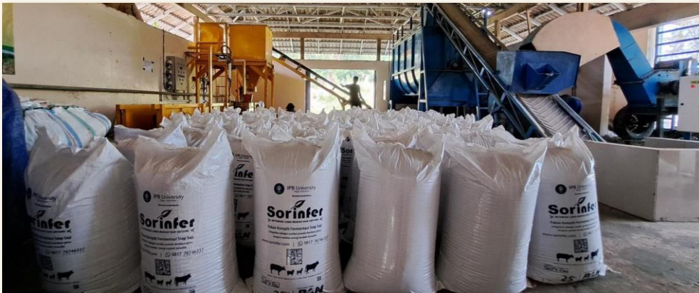
UJI COBA PRODUKSI PAKAN KOMPLIT FERMENTASI - UP3 JONGGOL (2021)