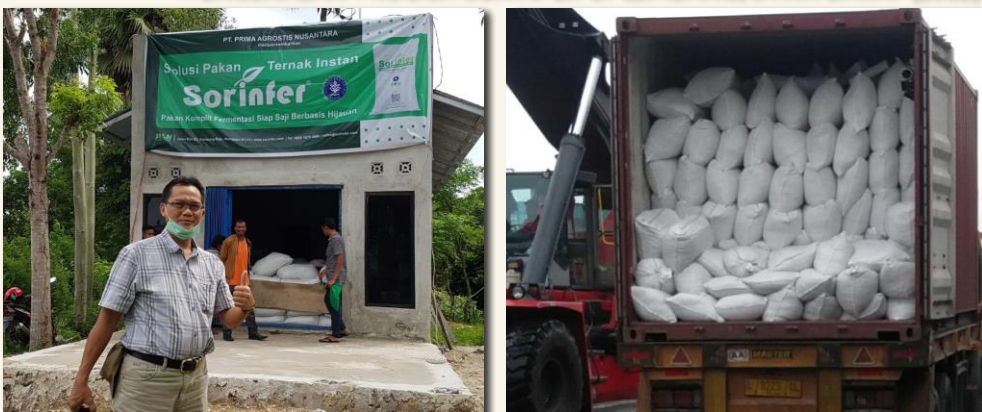
PENGENALAN PRODUK SORINFER DI WAINGAPU, NTT (2021)