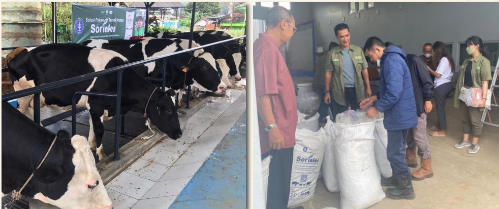
PENGENALAN PRODUK SORINFER DI LEMBANG, JAWA BARAT (2022)